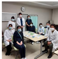
糖尿病療養支援チーム