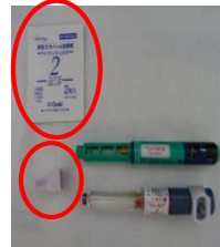
色のコントラストを付ける