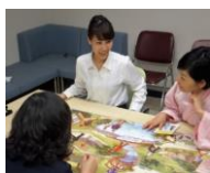
*医療従事者が患者さん役を演じています。

病態の受け止めや療養に取り組むにあたり抱える心理的負担感への支援も重点的に行っています。