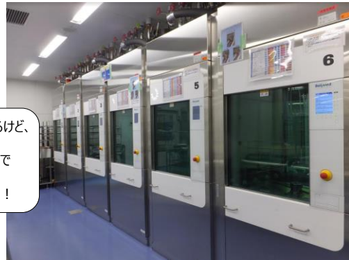
自動洗浄機（ウォッシャーディスインフェクター）

洗浄方法はいくつか種類もあるけど、メインのすごいやつはこれ！すごいパワーで洗浄から消毒までしっかり保証◎ジャバジャバ洗う姿は圧巻よ！！