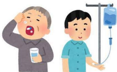
点滴・内服の管理

京大病院では脳卒中連携パスを用いることで地域の病院と円滑に連携できるように取り組んでいます。