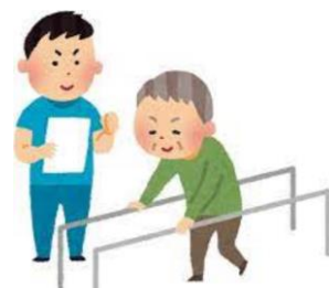
リハビリテーション